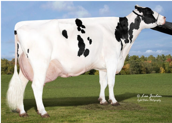
AURORA DOORSOPEN 17054 FOURTH DAM